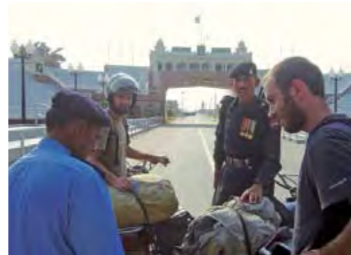
Llegamos a la frontera con Pakistán.

¡Por fin una frontera sin problemas burocráticos! Y así fue hasta España. Turquía preciosa, encontramos carreteras de 250 kilómetros de curva tras curva. La cara que ponía la gente cuando se enteraban de que veníamos desde Vietnam con esas reliquias ya empezaba a ser muy divertida. La aventura ya comenzaba a tener un matiz de peso; no veníamos del país de al lado. Por primera vez en todo el viaje contratamos un seguro de 15 días para las motos; fue por respeto a la frontera de entrada en Europa. Aquí se acabó el desorden asiático: entrábamos de nuevo en la civilización. Las motos seguían funcionando bien, sin grandes averías, sólo pequeños detalles. Como por ejemplo que quemar los