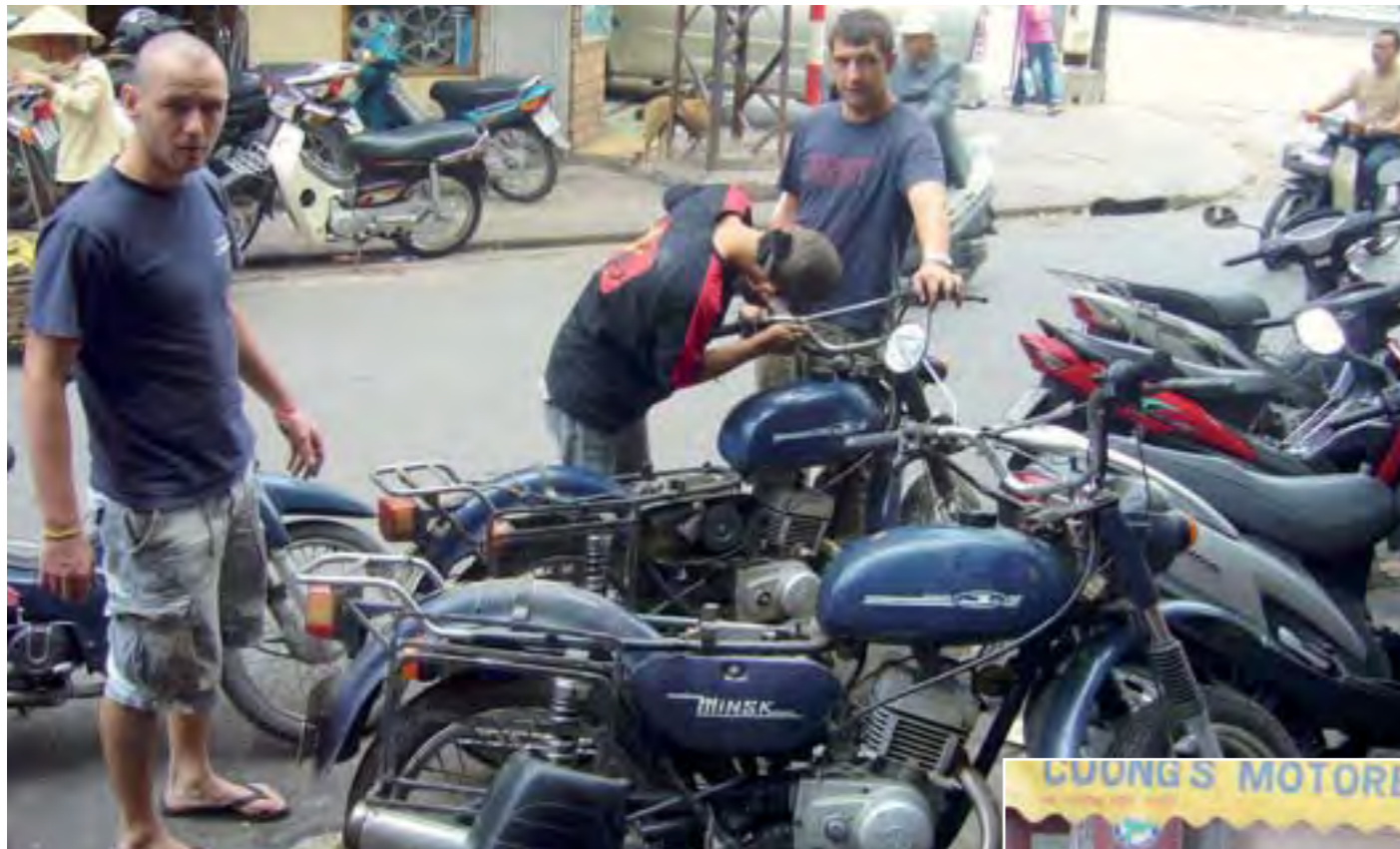
Reparando las Minsk en Hanoi antes de partir.

año planeando un viaje parecido. Cuando le contamos que nosotros compramos las motos un miércoles y el sábado siguiente ya partimos, ¡el tío flipó! En resumen, teníamos una idea, pero no teníamos idea!!!