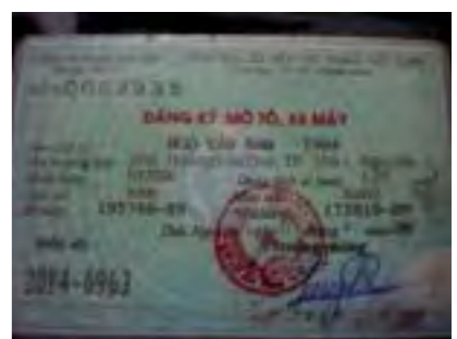
Ésta es la documentación de las Minsk.

entonces llegar sólo hasta la India o incluso Tailandia... En total hicimos unos 1.000 kilómetros por el norte de Vietnam. Era ya Navidad, y como regalos nos compramos un barril de 50 litros de cerveza que nos costó 6 euros... The spanish connexion! Por supuesto, lo cargamos con la Minsk. El día de San Esteban nos autoinvitamos a cenar en casa del embajador español en Vietnam, ¡todo un lujo! Hacemos las camisetas del viaje, una puesta a punto a las motos y el día 27 de diciembre partimos desde Hanoi hacia Laos. Coincidimos con un francés que llevaba un