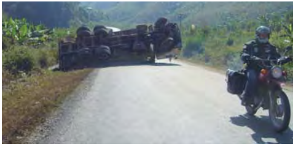
Es normal ver vehículos accidentados en Laos, y en todo el sudeste asiático...