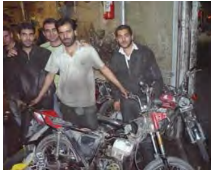
Un taller de Irán y sus trabajadores. Compramos piezas para las Minsk.