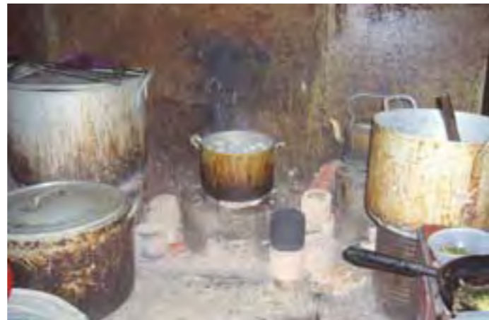
Aspecto de una cocina de una chabola en Vietnam.