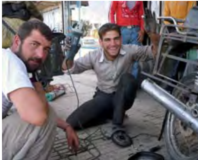
Este chaval nos arregló la moto gratis en Irán y nos invitó a bocadillos y refrescos.