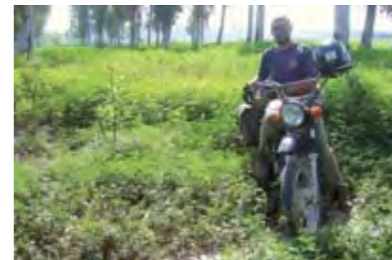
Los campos de marihuana son silvestres en la India. Crecen por todas partes...