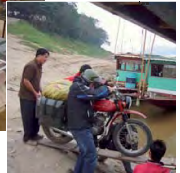
Subiendo las motos a la barcaza en Loangpravang,