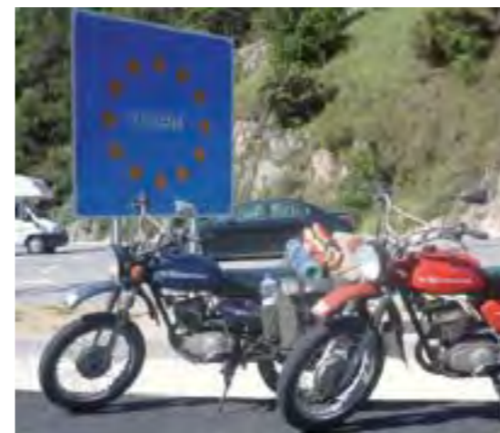
¡Ya entramos en España! Comienza el fin del viaje.

Nuestros aventureros preparan una nueva aventura, esta vez hacia África. Con una Honda FMX y una Honda XR, apoyados por un 4x4 y con un paramotor, tienen previsto partir el 15 de noviembre. Su nueva página web será www.thisisafrika.shutterstock.com