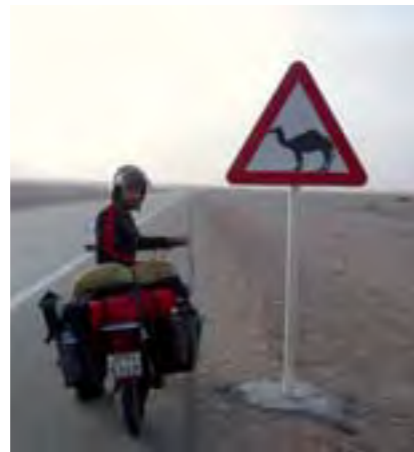
Varias señales advierten del peligro de icamellos! Aunque seguro que en esta planicie serán muy visibles...