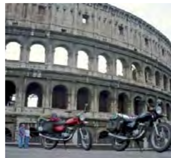
Foto obligada en Roma con el Coliseo, en nuestro paso por Italia.

Un domingo por la mañana paramos a hacer un