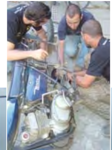
Reparando en la India una pequeña avería en una Minsk.