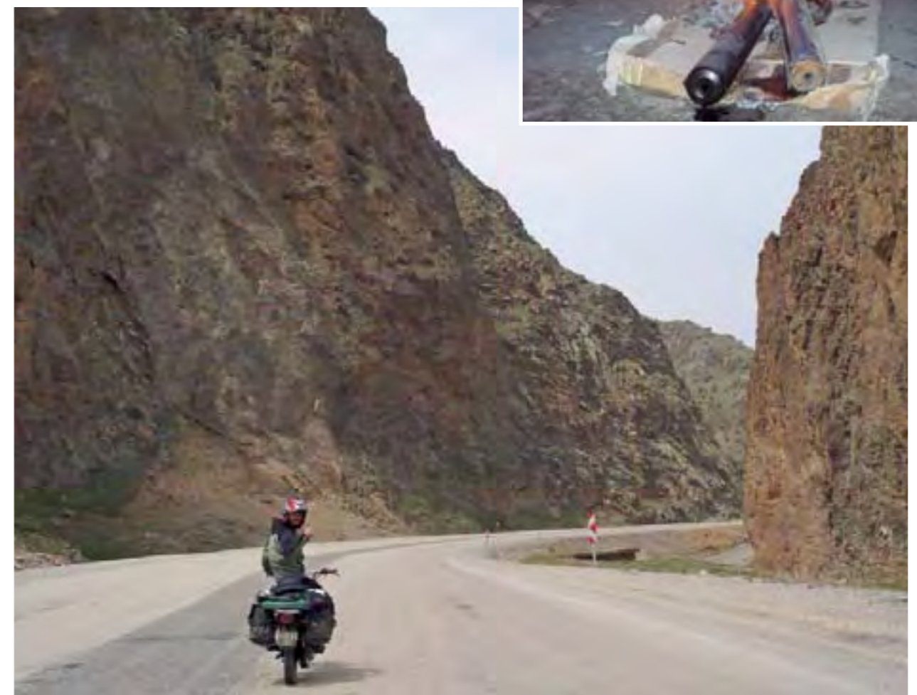
Ya en Turquía, sus desfiladeros asombran.