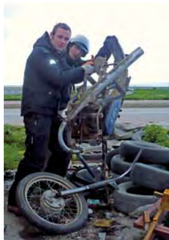
Desguazando una Minsk en Turquía, por si acaso.