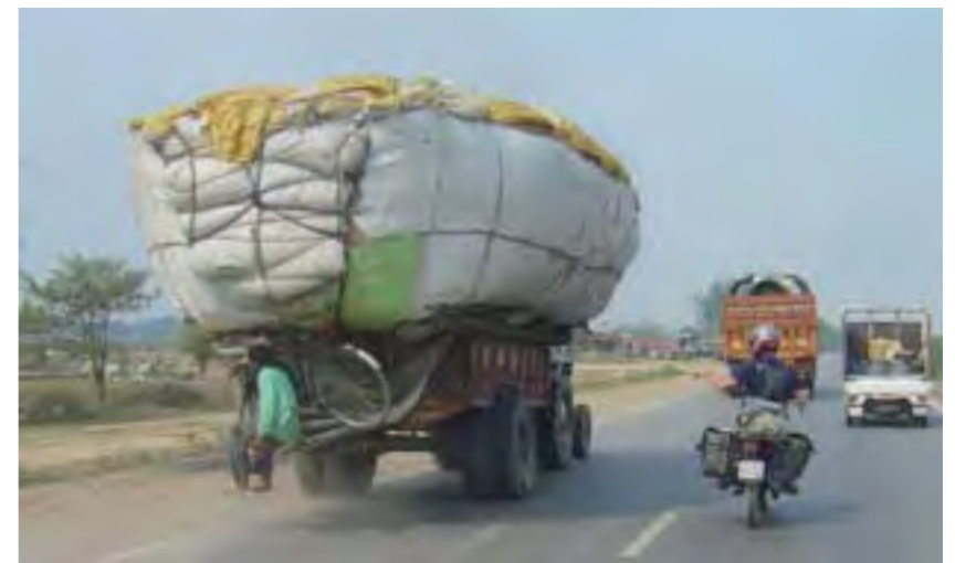
En la India, como en toda Asia, las normas de tráfico no son para ellos.