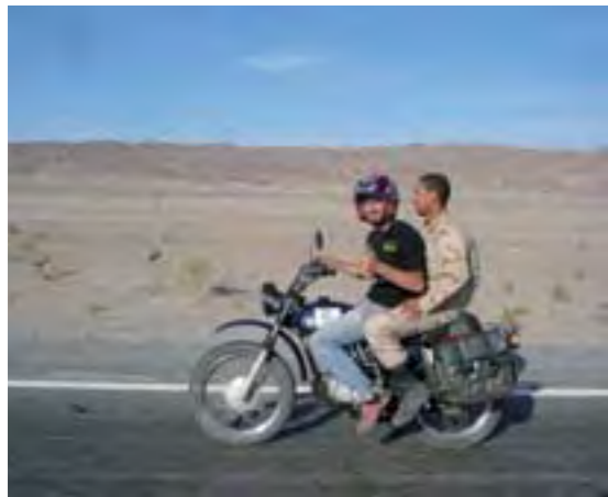
Por Irán, uno de los soldados subió como paquete y nos escoltó.