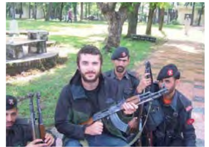
Fusiles, talibanes, ejército... la constante de nuestra estancia en Pakistán.