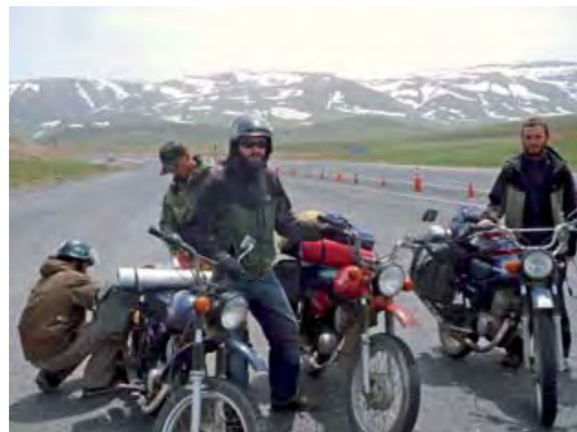
Un registro rutinario del Ejército turco.

escapes de las Minsk para vaciarlos del aceite quemado que se había adherido a sus paredes, obstruyendo el paso... ¡Como en los viejos tiempos de las 2T españolas!