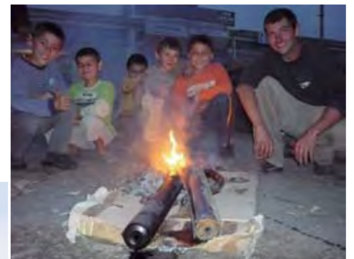
Quemamos los escapes de las Minsk para desmenuzarlas de la capa de aceite quemado.