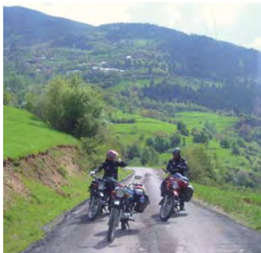
El verde abunda en las montañas turcas, una maravilla.