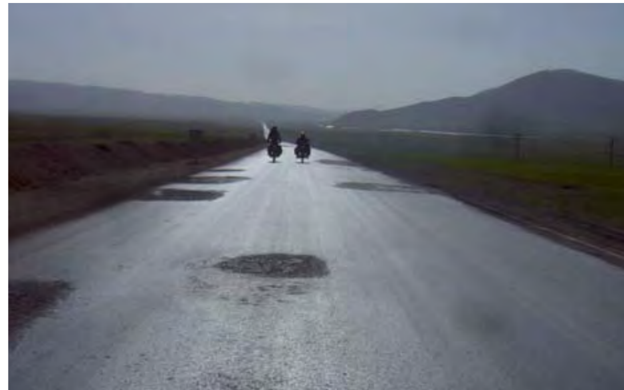
En Turquía era fácil encontrar largas rectas interminables y carreteras de montaña.