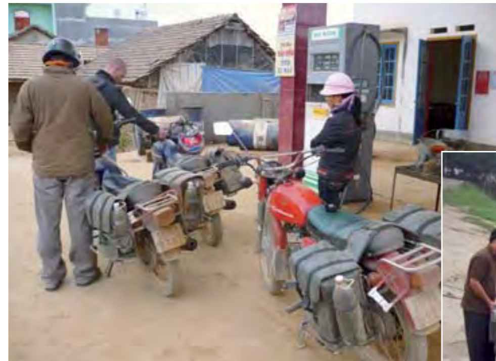
La gasolina en Vietnam es muy barata, aunque de mala calidad.