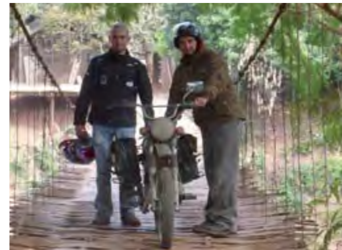
Tuvimos que atravesar más de un puente de chamizo...