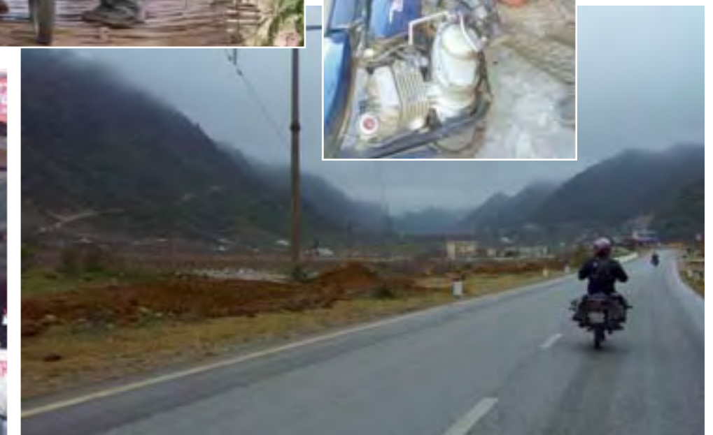
Laos vive sumido en una profunda pobreza.