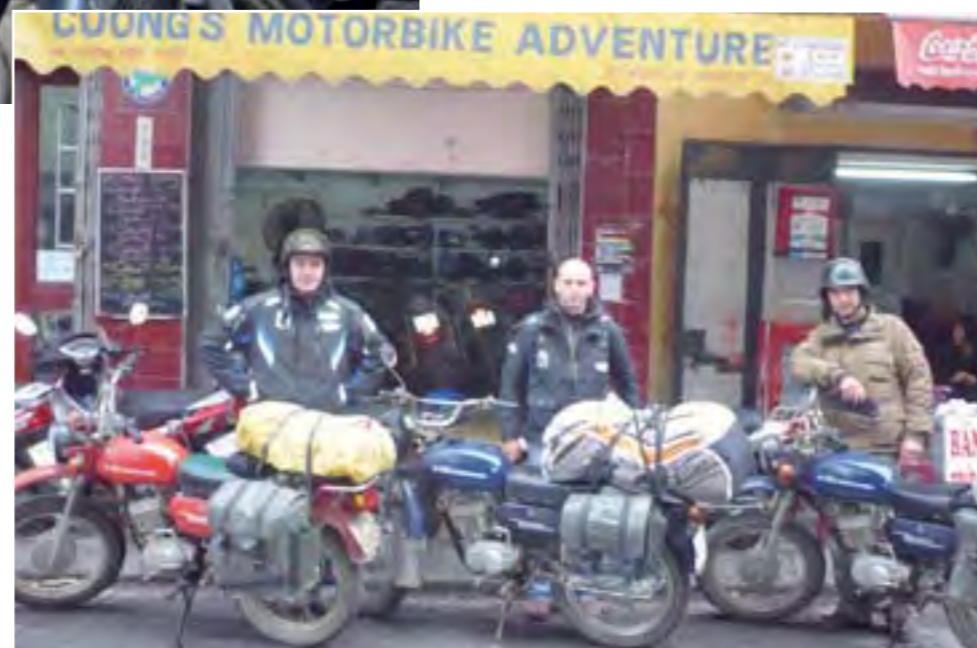
Aquí compramos las motos. Ya estamos listos para el viaje.

Superamos la frontera tailandesa sin ningún problema. Desde Chiang Mai a Bangkok, unos 700 kilómetros, pusimos las motos en un tren. Las Minsk de noche funcionan mucho mejor y empezamos a hacer algunas etapas nocturnas... En un día hicimos 400 kilómetros a 50 km/h!