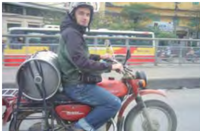
Cargaditos con un barril de cerveza que nos costó 6 euros en Vietnam...