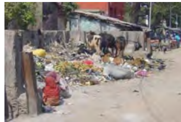
En las calles de la India hay mucha pobreza y suciedad.