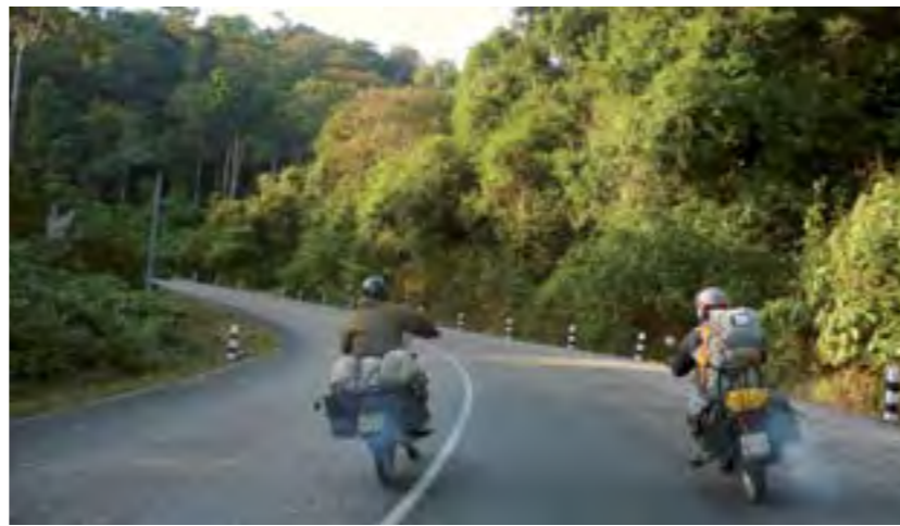
El verde intenso es la nota predominante, siempre.